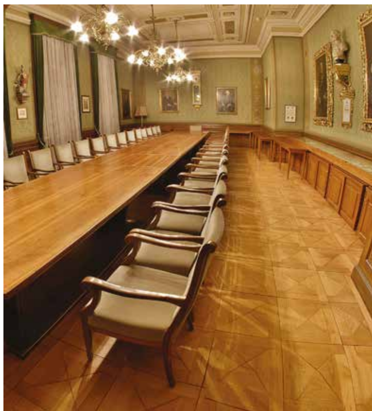
Зал засідань генеральної дирекції у м. Грац