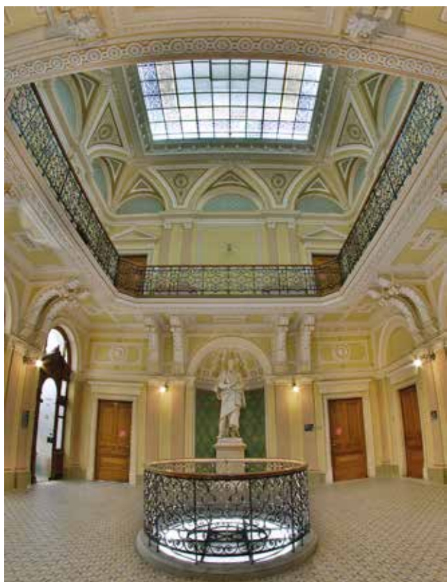
Хол генеральної дирекції у м. Грац

Національний банк України, що здійснює державне регулювання у сфері ринків фінансових послуг підтвердив: ГРАВЕ УКРАЇНА – прозора, надійна та стабільна страхова компанія, що працює на теренах України та бере на себе фінансові зобов'язання й вчасно їх виконує. Це вкотре офіційно підтверджено рішенням Регулятора у квітні 2023 року.