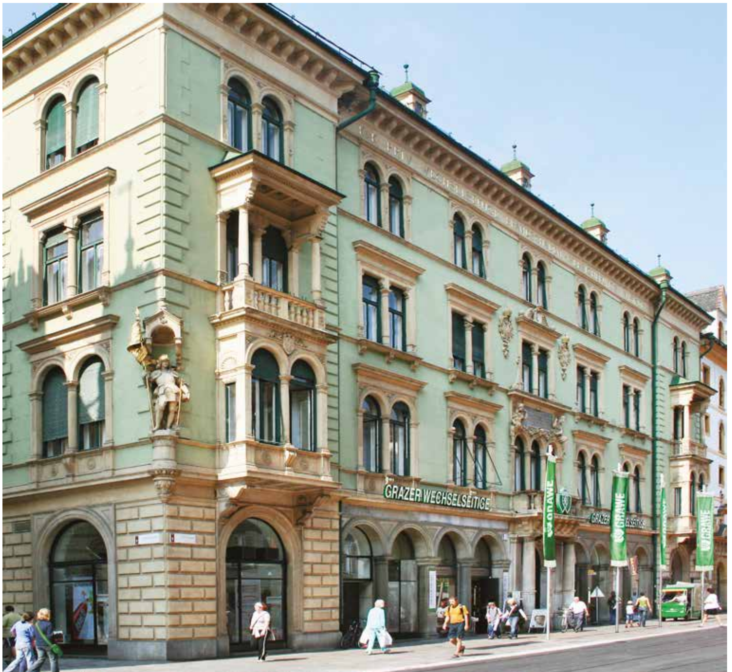
Центральний офіс у м. Грац

Індивідуальність кожної країни, національностей, людей, різноманіття їхніх цінностей, відносин, поєднується в єдине джерело, яке гарантує міць, силу та надає величі концерну GRAWE. Бути відкритим, розуміти потреби кожного клієнта, йти на зустріч, прагнути до нових досягнень, перспектив, позитивних змін – це головні завдання і складові стратегії подальшої діяльності всіх компаній у складі концерну. А комерційний успіх дає користь економіці кожної країни, де представлена страхова компанія концерну GRAWE.