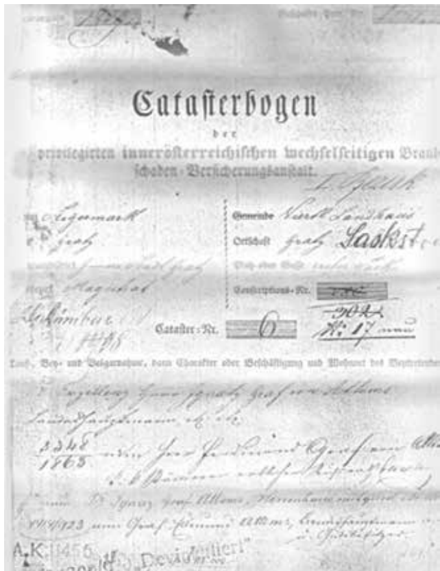
Договір укладений у 1829 р., який діє і донині

Десятки тисяч українських споживачів назвали «ГРАВЕ УКРАЇНА» найнадійнішою страховою компанією.