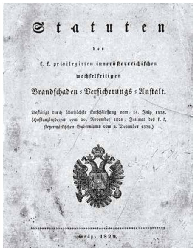
Статут 1829 р.

Висококваліфіковані спеціалісти компанії-засновника, головний офіс якого знаходиться в Австрії у місті Грац, координують роботу усіх компаній концерну, гарантуючи власним досвідом надійність та бездоганну якість обслуговування клієнтів.